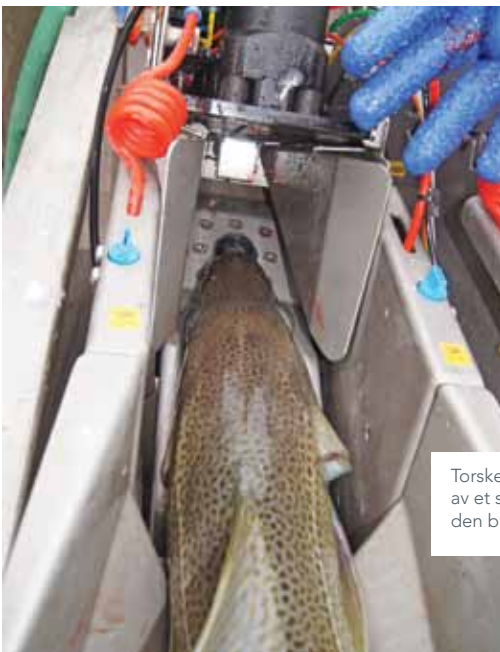
Torsken føres inn i maskinen og bedøves av et stempel fra oversiden samtidig som den bløgges fra undersiden.

Til de neste forsøkene om bord på M/K Bernt Oskar i 2012 ble det derfor foretatt justeringer av kniv, og laget nytt «inngangsparti» til maskinen tilpasset torskens hodefasong. I det neste forsøket så man at nye kniver og nytt inngangsparti ikke harmonerte og i det tredje og siste forsøket gikk man derfor tilbake til originalknivene, som man opplevde at maskinen traff presist på både stor og liten torsk.