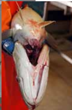
Her kontrolleres at bløggkuttet kutter åren fra hjertet, den såkalte ettsnitts-metoden. Det konstateres at maskinen treffer presist over et stort størrelsesområde og dermed vil kunne tas i bruk i fangstbehandlingen ombord på snurrevadfartøy og trålere.'